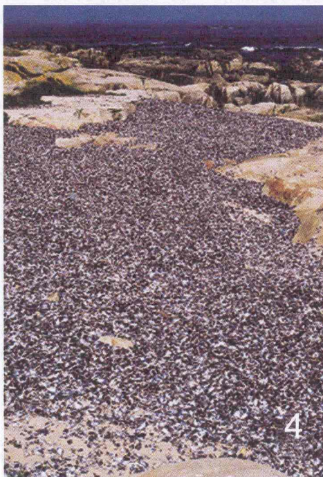
Figura 4 – Acumulação de conchas na zona das marés-vivas.